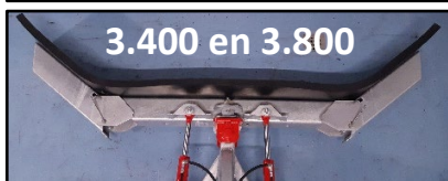
3.400 en 3.800